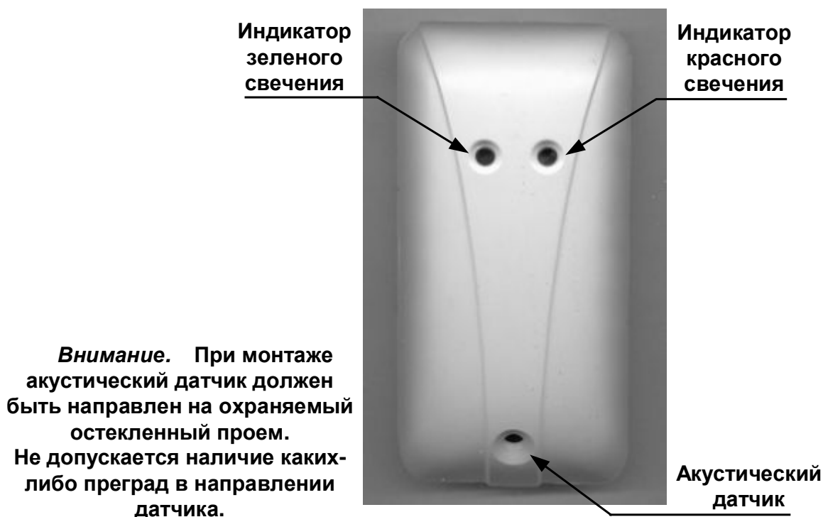
Рис. 1 Внешний вид ИРС

ИРС подключаются в АШ (адресный шлейф) и используются совместно с ППК «Рубикон» или КА2 «Рубикон».